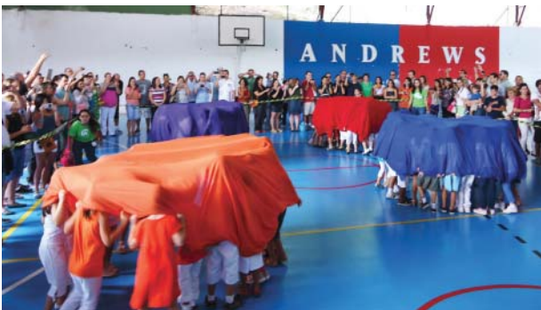
EXPOSIÇÕES, APRESENTAÇÕES DE MÚSICA, EXPRESSÃO CORPORAL E INGLÊS MARCARAM A FESTA DA EDUCAÇÃO INFANTIL E DO FUNDAMENTAL I