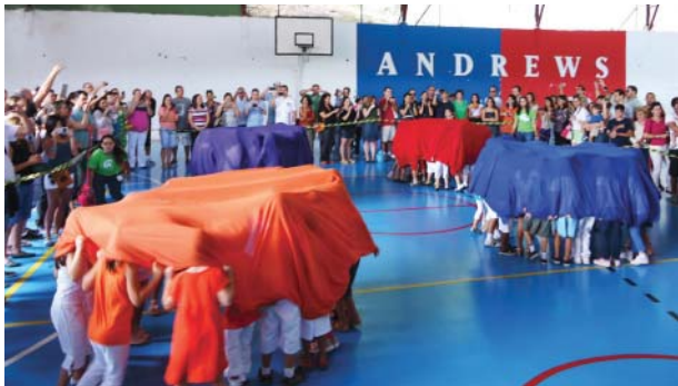
EXPOSIÇÕES, APRESENTAÇÕES DE MÚSICA, EXPRESSÃO CORPORAL E INGLÊS MARCARAM A FESTA DA EDUCAÇÃO INFANTIL E DO FUNDAMENTAL I