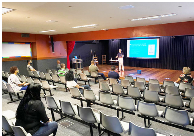
PROFISSIONAIS DO ANDREWS E TERCEIRIZADOS RECEBERAM TREINAMENTO DA DELPHI SOBRE PROTOCOLOS GERAIS E AÇÕES DE HIGIENIZAÇÃO E DESINFECÇÃO DOS ESPAÇOS

O Andrews mobilizará todo o seu empenho para atender a cada um da forma que se sinta mais confortável. Nas atuais condições da pandemia, o Colégio entende que não teria cabimento uma família se sentir constrangida a ter que, contra a sua vontade, expor o próprio filho a risco que considere desnecessário ou prematuro.